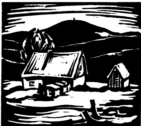
Nach einer Originalgrafik von Hans Weiß, Aue

email: info@kulturbund-aue.de im Internet: www.kulturbund-aue.de